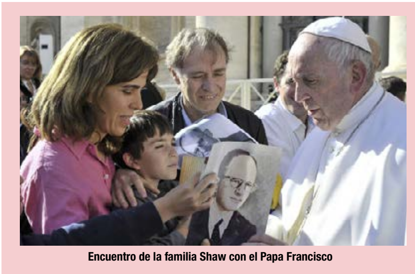
Encuentro de la familia Shaw con el Papa Francisco

La salud de Enrique empeoraba pero siempre enfrentaba sus padecimientos con entereza y coraje. Al final de su vida estaba muy enfermo y necesitó una transfusión de sangre, más de doscientos empleados de la fábrica