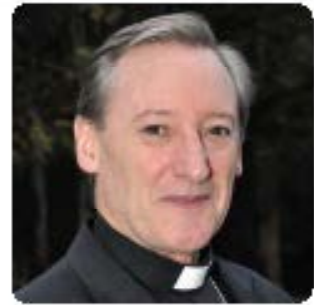
MONS. JOAQUÍN SUCUNZA CONVENIO SAN JOSÉ