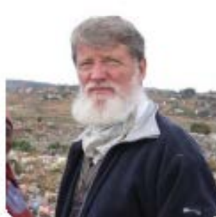
PADRE PEDRO OPEKA EL PODER DE LA FE EN MADAGASCAR