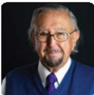
ULTIMA ENTREVISTA A CESAR PELLI "PASIÓN POR EL DISEÑO"