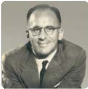
ENRIQUE SHAW CAMINO A LA BEATIFICACIÓN